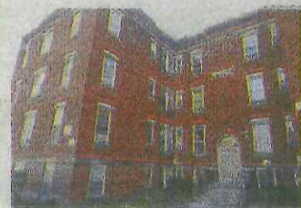
Carroll Street ORIENT BLD NY. 所在地/ニューヨーク州 ポーク郡 完成/リニューアルオープン