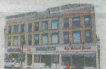
Main Street Bristol CT 06010 No.128 所在地/コネチカット州 フリステル