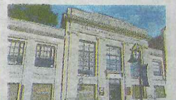
Main Street Bristol CT 06010 No.129 Residential 所在地/コネチカット州 フリステル