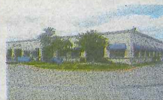
The MANHATTAN No.126 Fountain Plaza Cross Road 所在地/テキサス州 ダラス 土地/1エーカー 建物/オフィスビル