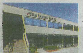
Wellington Office No.113 所在地/テキサス州 フォートワース 完成/2015年10月