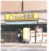
CoCo壱番中央区清川店