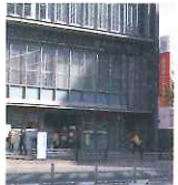
西日本シティ銀行渡辺通支店