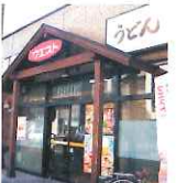
うどんウエスト渡辺通店